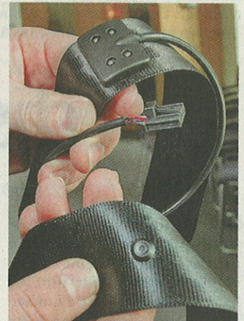
Nah am Sprecher: In dem kleinen Knopf hat Paragon das Mikrofon im Autogurt untergebracht.

Den Sonderpreis erhält der Küchenmöbelzulieferer Hettich für das neue Schubkasten-Plattformkonzept „Architech“, das sich durch besonderen Laufkomfort und hohe Belastbarkeit auszeichnet. Innovativ ist für die Jury auch die neue Fertigungshalle mit rund 13.500 Quadratmetern Nutzfläche am Standort Kirchlingern, die für eine effiziente Produktion errichtet wurde. „Das Unternehmen sichert so seine Zukunftsfähig-